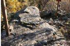
Besonders markanter Schalenstein (12)