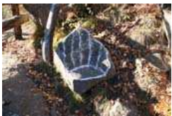
Kleine Steinbank (9)

Von Partschins (625 m) wandern wir zum Weiler Vertigen , wo wir bei der Jausenstation Grasweg Keller (743 m) den landschaftlich einmaligen Partschinser Waalweg erreichen. Wir gehen in Richtung Westen und treffen am Buhnholz auf den ersten prähistorischen Schalenstein (1) , auf welchem 8 Grübchen (teilweise beschädigt) verschiedener Größe zu beobachten sind. Diese Vertiefungen im Stein werden als Schalen bezeichnet; sie stammen aus der Zeit des mittleren Neolithikums (ca. 4.500 – 3.000 v. Chr.). Es handelt sich um stumme Zeugen der Ursiedler, deren Bedeutung viele Rätsel aufgibt und wohl nie ganz geklärt werden kann. Die Forschung vermutet in ihnen u.a. Fruchtbarkeitssymbole, die kultischen Zwecken dienen. Die Deutung dieser Schalen reicht auch vom Weihelicht zum Opferstein bis zum Sternbild und Mond – und Sonnenkalender und gibt Anlass zu manchem Gelehrtenstreit. Der Schweizer Archäologe, Ferdinand Keller , bemerkt dazu resignierend: „Es sind Hieroglyphen und Symbole, zu deren Erklärung der Schlüssel verloren gegangen ist.“ Auf jeden Fall gehören sie zu den ältesten Monumenten der Menschheit und sollen daher nicht unbeachtet bleiben.