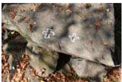
Steinplatte mit 2 Kreuzen (3)