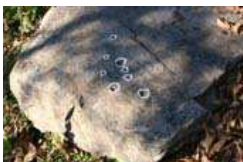
Schalenstein beim Ebnerhof (16)

Am Saltenstein halten wir beschauliche Rast, denn wir befinden uns wiederum an einem sagenhaften Ort. Die Sage erzählt, dass am Salten einst ein prächtiges Schloss stand, in dem Ritter Werdomer , Herr von Tabland, hauste. Er führte ein ausschweifendes Leben, unterdrückte und quälte seine Untergebenen und ermordete sogar seinen eigenen Vater. Im Jahre 1328 brach zur Nachtzeit das Strafgericht über die lasterhaften Schlossbewohner herein. Der Ginglsee im Zieltal durchbrach infolge eines fürchterlichen Unwetters seine Felsdämme und begrub das Ritterschloss und seine Bewohner unter Geröll und Schlamm. Unter dem Saltenstein soll noch die Glocke der Schlosskapelle begraben sein, die alle hundert Jahre, zu Peter und Paul am 29. Juni, läutet. Fromme Menschen sollen sie dann mit Hilfe von geweihten Gegenständen heben können, zusammen mit kostbaren Schätzen.