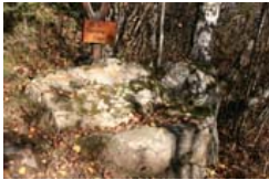
Rasterle Stein (11)