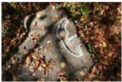
Steinplatte mit Einkerbung (4)