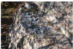
Geada Zopfstuan (6)