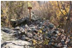
Wallburg aus der Jungsteinzeit (13)