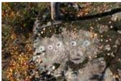
Schalenstein mit 5 Vertiefungen (10)